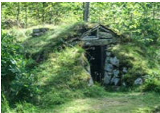
jordkula. Rekonstruktion i Hembygdsparken i Pärud

jordkolor var en gång bostäder för fattigt folk ingrävda i en backslutning med väggar av sten och jord samt tak av stänger, täckt med näver och torv. Ett litet fönster över dörren gav ett sparsamt ljus och en primitiv eldstad svarade för värmen. I Jordkulebacken vid Brudhyltan, Arby socken, finns lämningar efter sju jordkolor och i grannskapet kan man finna ytterligare åtta. En rekonstruerad jordkula kan beses i Hembygdsparken i Pärud. BB