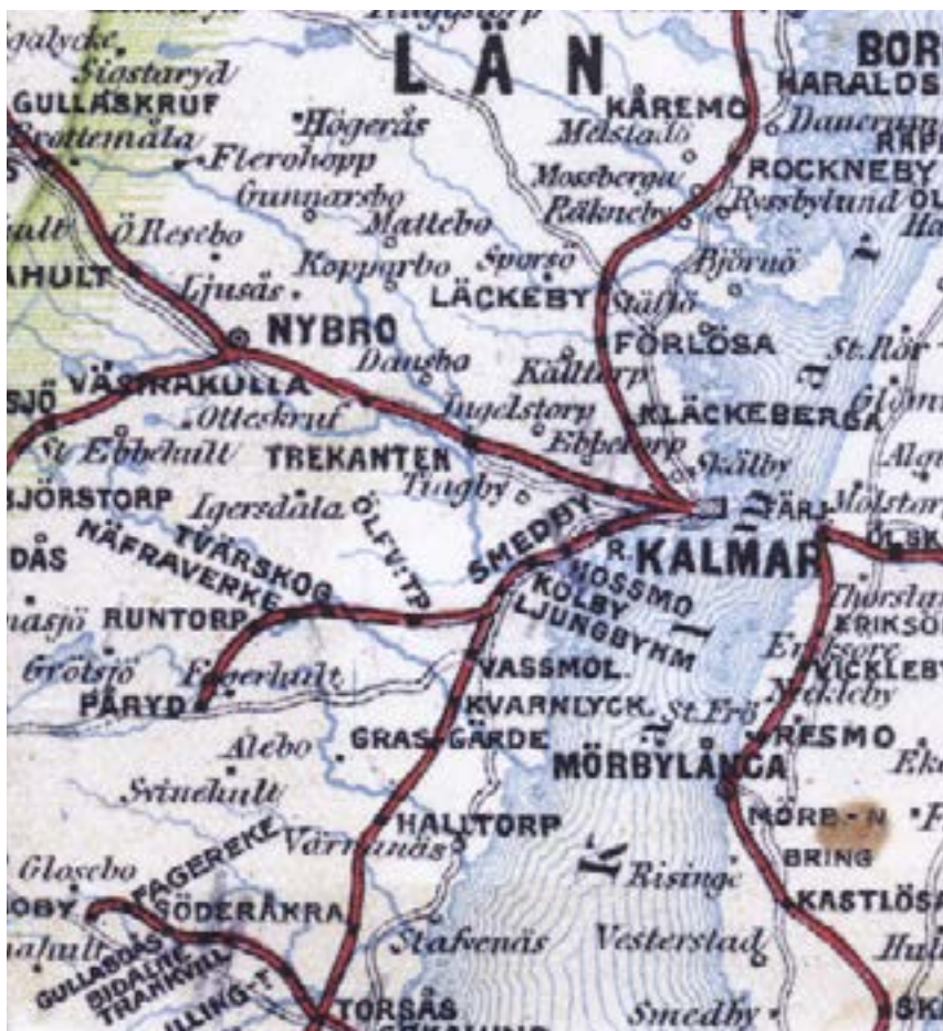
järnvägar som fanns i början av 1900-talet

na, erövrade och en tid höll halvön efter häftiga strider. Mot Skälbyviken i norr ligger en mindre badplats. På södra sidan av J ligger Fiskartorpet, som en gång tillhörde Skälby kungsgård. Strax väster om torpet byggdes 1902 Villa ›Talludden av Ragnar L ›Jeansson, om- och tillbyggd 1934 efter ritningar av arkitekt Adolf Wiman. På tomten, som fortfarande delvis döljs av en mur fanns tennisbana, badhus och trädgårdsmästarbostad. År 1989 köptes fastigheten av HSB, som där hade för avsikt att komplettera huvudbyggnaden med flyglar, inrymmande kontor och bostäder. Endast bostäderna blev verklighet. De har senare fått sällskap av radhus nere vid den grävda kanal, byggd 1941, som skiljer halvön från fastlandet. GM