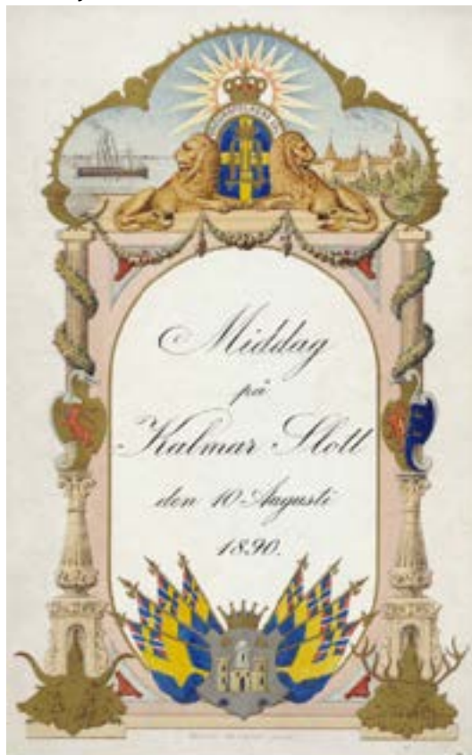
Janssons Litografiska Tryckeri. Meny från kungamiddag när Oscar II gjorde sin sommarresa längs svenska kusterna 1890