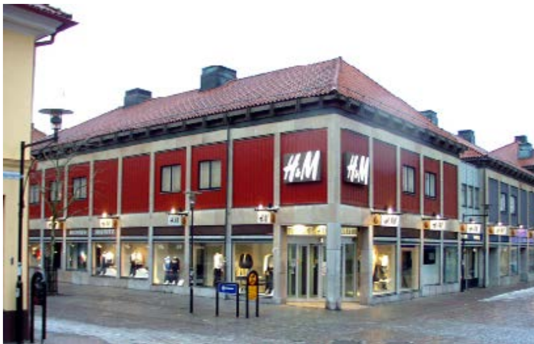
Evald Jonnergård. Kontors- och butiksprojekt i kvarteret Kopparslagaren vid korsningen Norra Långgatan–Kaggensgatan

minister, s.k. personal- och löne­minister, 1979–1982. Under åren 1987–1998 var J partiledare för Centerpartiet. År 1991 blev han miljöminister i Bildts borgerliga koalitionsregering, en post som han dock lämnade sommaren 1994 i protest mot byggandet av Öresundsbron. J utsågs 2006 till ordförande i ›Kalmarsundskommissionen.