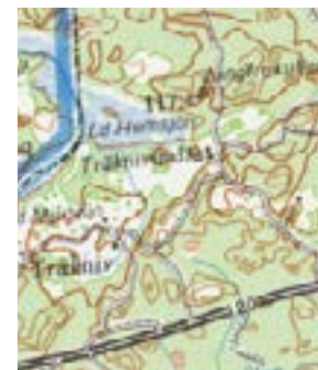
Jungfrukullen. Kalmar kommuns högsta punkt.

Jordbroporten. I förgrunden Stenklottet i vattnet, gåva av Carl-Henrik Åfors.