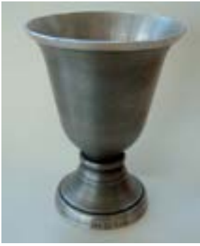
Rune Tennesmed