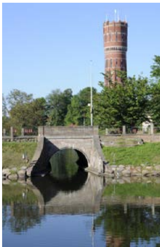
Tullbron och Tvättfatet.

Tullhuset , Ölandsgatan 30, byggdes för Tullkammaren och Kalmar hamn 1885–1886 efter ritningar av stadsingenjör C H ›Öhnell. När hamnen hade utvidgats åt söder 1852–1855 kunde T placeras på utfylld mark strax utanför den tidigare rivna befästningsmuren kallad ›Preussar-