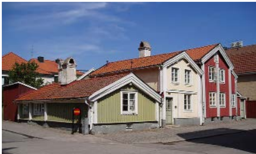
Tripp Trapp Trull.

fotbollarna till dessa trakter. Idrottsplatsen Åvallen invigdes 1944 efter mycket arbete av medlemmar och har senare kompletterats med ungdomsplaner och ytterligare en gräsplan. Klubbhuset uppfördes 1971. Utöver fotboll har T tidvis haft gymnastik, brottning, bordtennis och schack på programmet. Föreningen satsar numera på fotboll för herrar, damer och ungdomar samt gymnastik. Herrlaget spelar (2014) i div. 4 SÖ och damlaget i div. 3 SÖ.