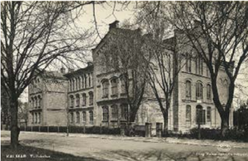
Tullskolan stod klar 1878

1878 och är därmed den äldsta av de stora folkskolorna i Kalmar. Huvudritningarna till den fristående gymnastiksalen, som stod klar 1913, gjordes av Sven ›Rosman efter J Fred. ›Olsons skisser.