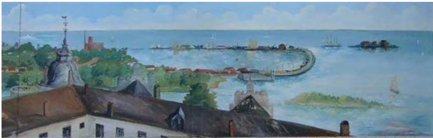
Tjärhovet. Målning av Erik Lönnegren i Paviljongen i Folkets Park

gravarna och då hittades olika fynd från yngre järnålder, vendeltid och äldre vikingatid. I ett brandlager i ett av rösen hittades ett stort antal nitar och nithuvuden av järn, ett 30-tal spelbrickor, några krukskärvor och rester av en svärdsknapp. En annan grav är en typisk järnåldersgrav där likbålet troligtvis stått på platsen. I en av domarringarna hittades fynd som kan dateras till vikingatid. BB