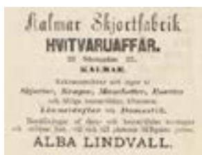
textiltillverkning. Ett av företagen i Kalmar var Kalmar Skjortfabrik

Thalén, Gösta , chefredaktör, se ›Barometern.