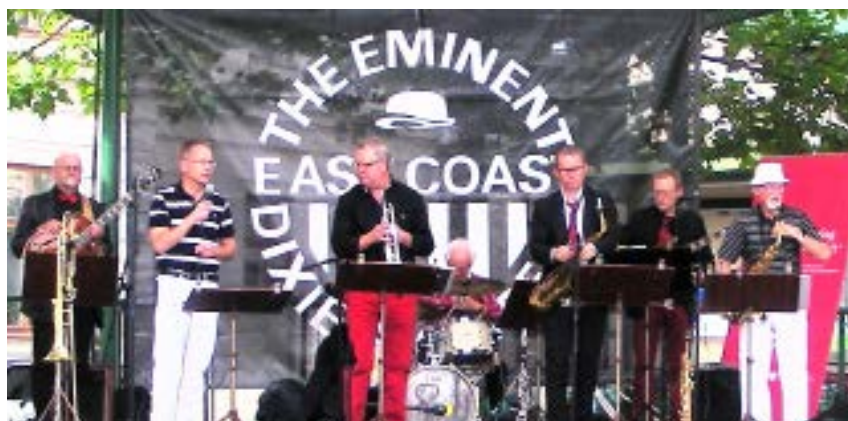
The Eminent East Coast Dixie Stompers