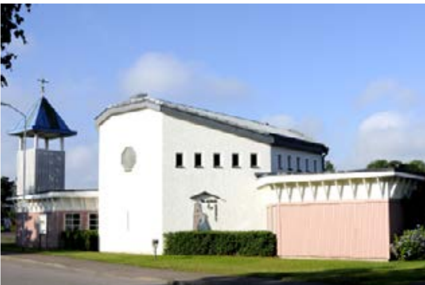
Två systrars kapell.

Tullslätten heter den breda gata och öppna plats som begränsas av Södra vägen och Unionsgatan. Vid T ligger ›Stadsbiblioteket och Tullbroskolan se ›Tullskolan. T syftar på stadens landtull som förekom i svenska städer 1620–1810. På äldre kartor var området större och betecknades ›Kämpbacken. Under 1800-talets mitt fanns här flera krogar och väderkvarnar. Kreatursmarknader hölls och traktens bönder bedrev torghandel. Stadens spöpåle fanns här ända till 1800-talets andra hälft. Förändringarna av T började i samband med Tullskolans tillkomst 1878. IB